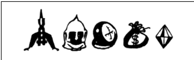
Objetos y riquezas

En esta magnífica Mantronix 3-D, aventura de arcade, debes liquidar a los cuatro criminales planetarios, XTRO II, ARIEL HEAD, MAX PORKA y YOKAHAMA... ¡y sobrevivir!