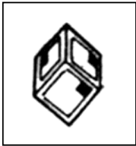
Cubos de poder